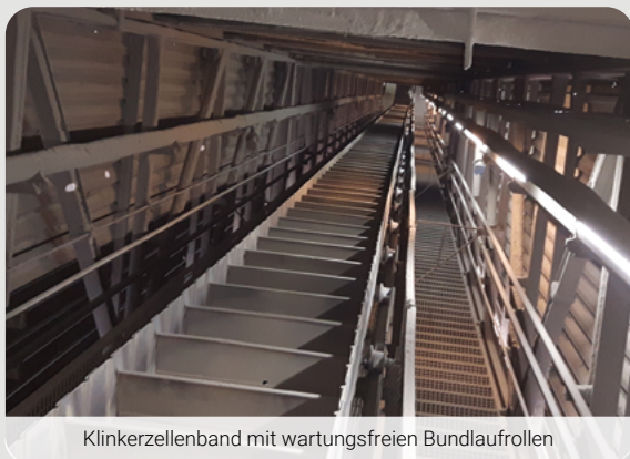
Klinkerzellenband mit wartungsfreien Bundlaufrollen

Führungs- oder Stützrollen werden in der Schüttgutindustrie unter anderem in Elevatoren und Zellenbändern verbaut und sind in der Regel auf einer Achse oder einem Wellenstummel montiert. Die Nachschmierung der darin montierten Kugellager erfolgt über Schmiernippel. Wenn die Schmierintervalle eingehalten und diese Arbeiten korrekt durchgeführt werden, kann eine sehr lange Lebensdauer erreicht werden – immer auch abhängig vom Fördergut und den Einsatzparametern. Meist bietet jedoch eine wartungsfreie Variante wesentliche Vorteile hinsichtlich Standzeit und Wartungsaufwand.